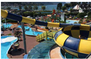
Aquapark Le Bouveret

Verwandte mit Kindern (9 und 12 Jahre) aus dem Ausland kommen für ein paar Tage zu Besuch. Wir diskutieren über einen Ausflug, den Sie mit ihnen machen könnten. Auf den Bildern sehen Sie vier Möglichkeiten. Machen Sie Vorschläge für einen passenden Ausflug. Was finden Sie gut? Warum?